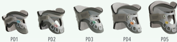
Aspen™ pädiatrische Zervikalorthese 23.12.03.2011