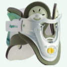
Aspen Vista™ MultiPost Zervikalorthese 23.12.03.2009