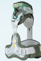
Aspen Vista™ CT04 23.12.01.1005