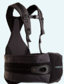
Aspen Horizon™ 456 TLSO 23.15.04.4020