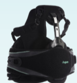
Aspen Vista™ 464 TLSO 23.15.02.0003