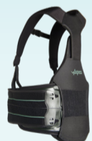
Aspen Summit™ 456 TLSO 23.15.04.4018