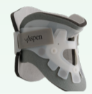
Aspen™ Zervikalorthese 23.12.03.2011