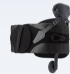
Aspen Tri-Point F50™ Skoliose Entlastungsorthese 23.15.04.3007