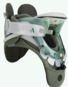
Aspen Vista™ Therapie Zervikalorthese Frei verkäuflich