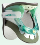
Aspen Vista™ Zervikalorthese 23.12.03.2009 Aspen Vista™ ITS Nackenplatte (Nur Rückenplatte)