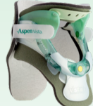
Aspen Vista™ TX Zervikalorthese 23.12.01.0005