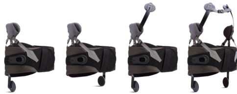
Viele Möglichkeiten - eine Orthese

Dank der Vielzahl an Konfigurationsmöglichkeiten kann der Therapeut die Behandlung individuell auf den Patienten einstellen. Mit dem Modulsystem kann der Therapeut die Orthese individuell zusammenstellen, um eine bestmögliche Versorgung zu gewährleisten.