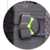
Konfigurationsset mit Doppelstreben